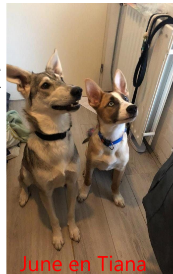
June en Tiana